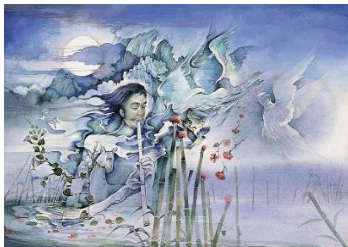
تصویر ۳. حبیب‌الله صادقی، هجران شماره دو، ۴۰ در ۳۰ سانتی‌متر. آبرنگ روی مقوا، (URL ۳ )