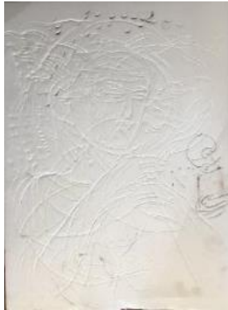
تصویر ۱. اتود ۵