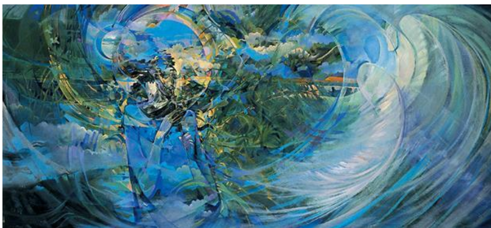
تصویر ۱. حبیب الله صادقی، هجران، شماره یک، ۱۳۶۸، ۲۶۰ در ۱۲۰ سانتی متر، میکس مدیا، (URL)