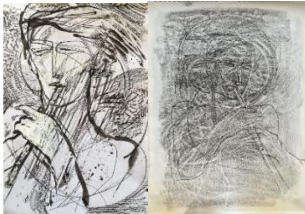
تصویر ۲. اتود ۶