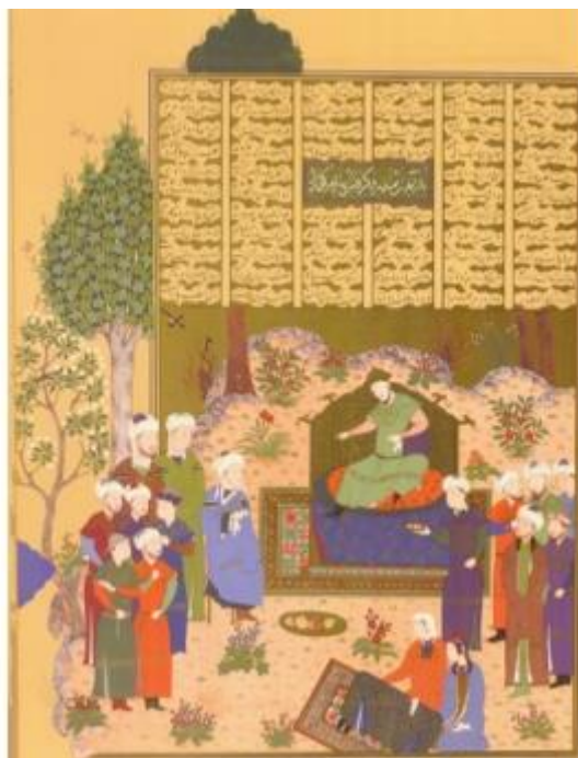
تصویر ۲. نگاره پادشاهی یزدگرد سوم. شاهنامه بایسنقری. قرن ۹ ه.ق. دوره تیموریان

در شاهنامه اسب موجود یاری‌گر، ارزشمند و دارای عواطف بسیار است. فردوسی در این داستان اسب را در معنای اساطیری آن مورد توجه قرار داده است. اسب‌های اسطوره‌ای در شاهنامه مورد توجه قرار گرفته‌اند. رخس، شبرنگ بهزاد، اسب سیاوش، اسب سهراب و ... همه از نموده‌های این حیوان آیینی و اسطوره‌ای در شاهنامه است «در دعاها و نیایش‌های مذهبی زرتشت از اهورامزدا درخواست می‌کند که بینایی و شنوایی چون بینایی و شنوایی اسب را به وی اعطا کند و قدرتی همچون قدرت بازوان و پاهای او را به وی ببخشد» (زرقانی، ۱۳۸۷: ۱۷۲). در این داستان، یزگرد بزه‌گر به خودبینی دچار شده است. «که از خویشتن دید نیکی همه» و همین امر سبب می‌شود که اسب دریایی که رمزی از دنیای درون اوست، او را به خویشتن خویش بازگرداند.