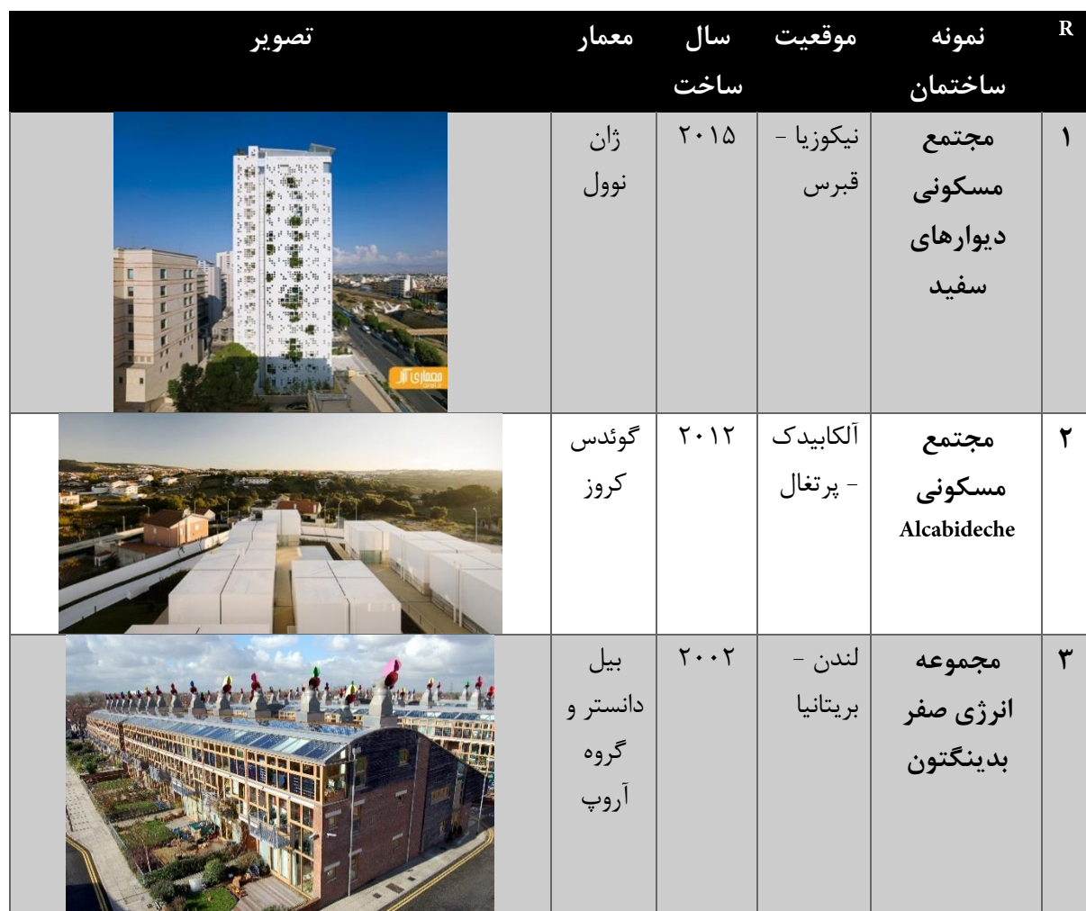
جدول ۱- نمونه ساختمان‌های مسکونی پایدار

در جدول ذیل نمونه ساختمان‌های مسکونی ساخته شده با مصالح هوشمند در جهت دستیابی آن‌ها به صرفه‌جویی در مصرف انرژی معرفی شده است: