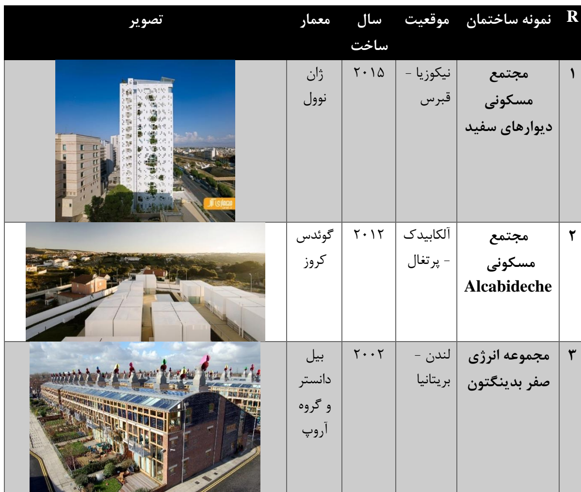
جدول ۱- نمونه ساختمان‌های مسکونی پایدار

در جدول ذیل نمونه ساختمان‌های مسکونی ساخته شده با مصالح هوشمند در جهت دستیابی آن‌ها به صرفه‌جویی در مصرف انرژی معرفی شده است: