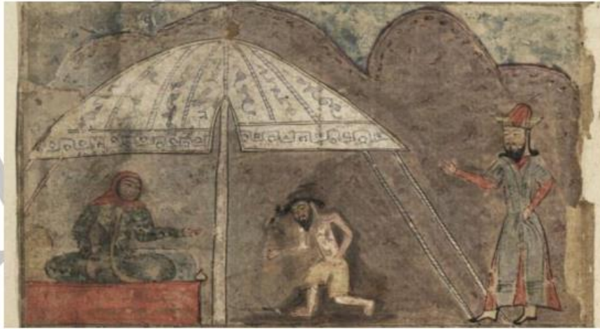
تصویر ۳: غزل گفتن مجنون در حضور لیلی به نخسلستان، مکتب مغول، خمسه نظامی، ۷۱۸.

به نظر می‌رسد شعر منزوی در این زمینه، کارکردی موفق و تحسین‌برانگیز دارد.