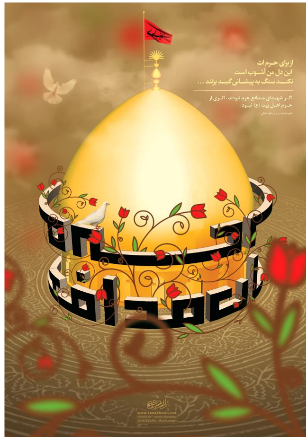
تصویر ۳- پوستر مدافعین حرم، دورهٔ معاصر.

نقطهٔ ثقل مضمونی چهار بیت مذکور، در حرف ندا و منادای "یا حمزة العربی" است. در واقع شاعر در این بیت، شخصیت شیخ را به شخصیت دینی و تاریخی حمزه (ع)، تشبیه می‌کند و اگرچه تشبیه دربردارندهٔ مضمون سخریه است، اما می‌توان آن را از انواع تشبیهات تلمیحی به حساب آورد. تشبیه تلمیحی، تشبیهی تشبیه را می‌توان به اساطیری، تاریخی، دینی، عاشقانه، فرهنگی، علمی و... تقسیم کرد.