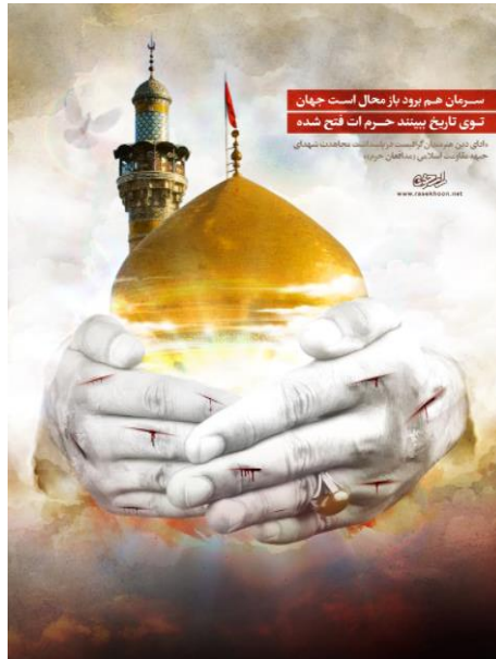
تصویر ۴: پوستر مدافعین حرم. دوره معاصر.

در این تصویر، هنرمند کوشیده تا به تشبیه کردن مدافعان حرم بر گرد حرم به نقش حمایتی آنها اشاره کند.