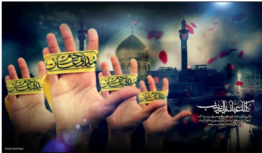
تصویر ۲- پوستر مدافعین حرم، دوره معاصر.

ابیات مذکور علاوه بر تشبیه، در بردارنده آرایه جان بخشی یا همان تشخیص است؛ بدین صورت که شاعر شعر خود را همچون انسان جنگاوری دانسته که قدم در میدان مبارزه نهاده و در راه وطن، تکه تکه شده است. آخرین بیت نیز به طور کامل، اقتباسی است از مضامین فخری و حماسی پرتکرار استفاده شده در اشعار جاهلی عرب. استفاده از تصویرسازی قرآن در رابطه با روز قیامت نیز از دیگر اقتباسات شاعر در زمینه تصویرسازی است. در تصویر شماره دو نیز طراح با کاربست رنگ قرمز در پوستر و رنگ زرد به عنوان نور، از این نمادها به عنوان تشبیهی برای تقدس حرم اهل بیت و مبارزه خونین بهره جسته است.