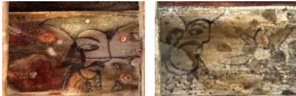
تصویر ۳: چهره مردان- بنای خداوردی

بررسی‌ها نشان داد، از روی ظاهر تصویر مردان موجود در شیرسرها نمی‌توان به هویت حقیقی آن‌ها پی برد. این تصاویر معمولاً به صورت فرم چهره‌هایی در قالب یک نقش و بدون توجه به سن و سال آن‌ها ترسیم شده‌اند (تصویر ۳). نکته دیگر این‌که هیچ‌کدام از نگاره‌های مردان ریش ندارند اما همه نمونه‌ها، دارای سبیل بلند که نماد قدرت مردانه است؛ در جامعه‌ای که نگرش و شیوه حکومت پدرسالارانه بوده و بازتاب آن در حوزه اجتماعی جامعه، به‌ویژه در برخورد با زنان انعکاس یافته بود. چهره نیم‌رخ مردان با ترسیم چشمان از روبرو که گویی چشم به زنان دوخته‌اند، شاید نمودی عینی از مورد تائید قرار گرفتن زنان آن جامعه پدرسالار؛ چه از دید زیبایی ظاهری و چه از منظر اجتماعی است. همین‌طور، از نحوه ترسیم نیم‌رخ و رو به زن مردان، گمان بر تماشایی بودنشان بر قدرت زن در کار، تولید، زایش و غیره می‌رود. لورا مالوی (۱۹۸۹)، نقش زنان و مردان را در هنرهای بصری چنین تشریح می‌نماید: زنان به‌عنوان عاملی که در معرض دیده شدن قرار می‌گیرند و مردان به‌عنوان دیدار پردازان فعال شناخته شده‌اند.