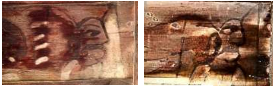
تصویر ۱۱: ایزدان- بنای خداوردی

ایزد [تیشتر] نگهبان باران و فرشته روزی و رزق است که از وجود او، زمین پاک از باران‌های به‌موقع برخوردار می‌شود و کشتزارها سیراب می‌گردند (یاحق، ۱۳۸۸: ۲۶۱). تیشتر، نیروی نیکوکاری است و در نبردی کیهانی با آپوشه یا آپوش، دیو خشک‌سالی و تباه‌کننده زندگی است، درگیر می‌شود (هینلز، ۱۳۷۷: ۳۶-۳۷) و سرانجام او را شکست داده و آب‌های آسمانی را بر زمین فرو می‌ریزد. به هر حال اسطوره تیشتر نشان می‌دهد که ایرانیان از دیرباز به نبرد خوبی و بدی می‌اندیشیده‌اند و برای مبارزه با کم‌آبی و خشک‌سالی، اسطوره نبرد تیشتر و آپوش دیو را پرورانده‌اند تا به‌نوعی ستایشگر ایزد- ستاره باران باشند (اسماعیل پور مطلق، ۱۳۸۱: ۹۳). تیشتر ایزدی است، پدید آورنده فرزندان از مردمان (هینلز، ۱۳۷۷: ۷۷) و با قرار گرفتنش در میان ایزدبانوها و زنان، اصل توالد، تناسل و زایش تصویر می‌شود و با باران‌آوری که همه ساله تکرار می‌شود به زندگی گیاهان و جانوران و مردمان این مرز و بوم جانی دوباره می‌بخشد.