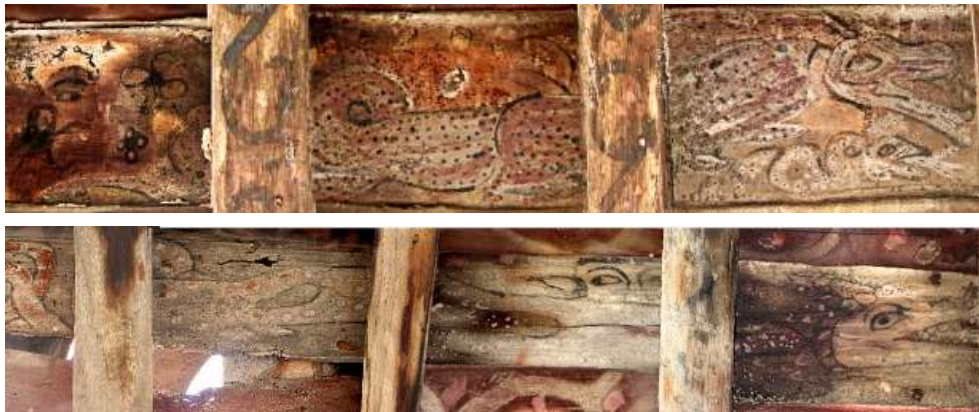
تصویر ۱۵: اژدها-مار- بنای خداوردی

در چند نمونه نقش شده بر سقف خانه خداوردی، تصویر اژدها، برگرفته از شکل مار؛ مارهای عظیم‌الجثه خزنده دیده می‌شود که اصطلاح اژدها-مار مناسب این نگاره است. سر این گونه اژدها، همچون سر گرگ است. پوزه‌ای دراز، دهانی باز که در بعضی، دندان‌شان از دهان بیرون زده و شعله آتشی از آن می‌جهد. در مواردی، از فراز سر اژدها مارها، شاخ و برگ‌گی خارج شده که نماد جوانه زدن است (گربران، ۱۳۷۷: ۱۲۸) و تنه دراز، نرم و به هم پیچیده دارند. با مشاهده این نگاره‌ها در حالی که تصاویری از زن و ایزدبانو در پس آن‌ها دیده می‌شود، به نوعی ارتباط بین این دو نقش می‌توان اشاره کرد؛ مبنی بر باروری و زایش، اژدها نماد آب آسمانی و بارور کننده زمین است او موکل صاعقه است (گربران، ۱۳۷۷: ۱۲۸) و هم این‌که این نوع ترکیب در نگاره، اشاره به عنوان شوهر زن را دارد؛ میرچا در کتاب خود عنوان می‌کند؛ اژدها-مار در ابرها و دریاچه‌ها خانه دارد و موکل صاعقه است، آب‌های آسمانی را به سوی زمین سرازیر می‌کند و موجب باروری کشت و بارگیری زنان می‌شود (۱۳۷۲). از طرفی، این نوع ترکیب، با توجه به بیتی که منسوب به فروسی است: زن و اژدها هر دو در خاک به / جهان پاک ازین هر دو ناپاک به؛ نگرش جامعه مردسالار به زنان در مورد زن‌ستیزی قابل تأمل و بررسی باشد.