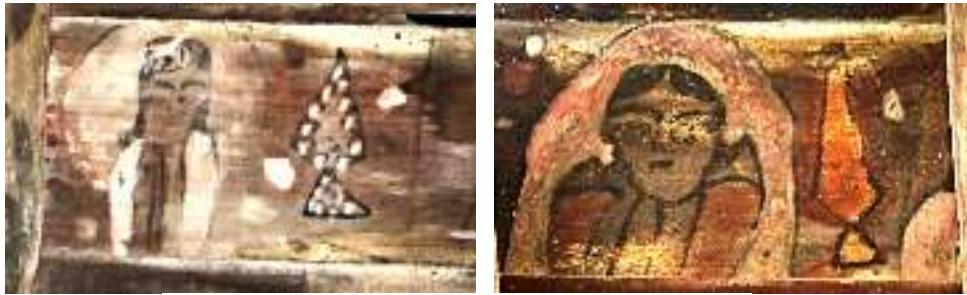
تصویر ۱۹: نقش اشیا- بنای خداوردی

در بین نگاره‌ها، اشیائی به تصویر کشیده شده‌اند که هم جنبه تزئینی و هم نقش وسیله‌ای کاربردی دارند. هنرمند از شیء نمادین؛ سرمه‌دان و یا آینه که مرتبط با زنان بوده؛ در چند مورد مقابل تصویر زنان ترسیم کرده که نمایانگر ابزار بزرگ و آرایش زنانه است. در مورد این نماد به‌طور عموم و به‌ویژه در خاور دور تصور می‌رفت که آینه دارای خواص جادویی است و با تصور، آینه می‌توانست ارواح خبیث را از این جهان و در جهان دیگر دور کند (هال، ۱۳۸۰: ۴) و این مطلب با توجه به این‌که مردم عامی اعتقاد به نوشته و نقش پشت آینه دارند قابل بررسی است.