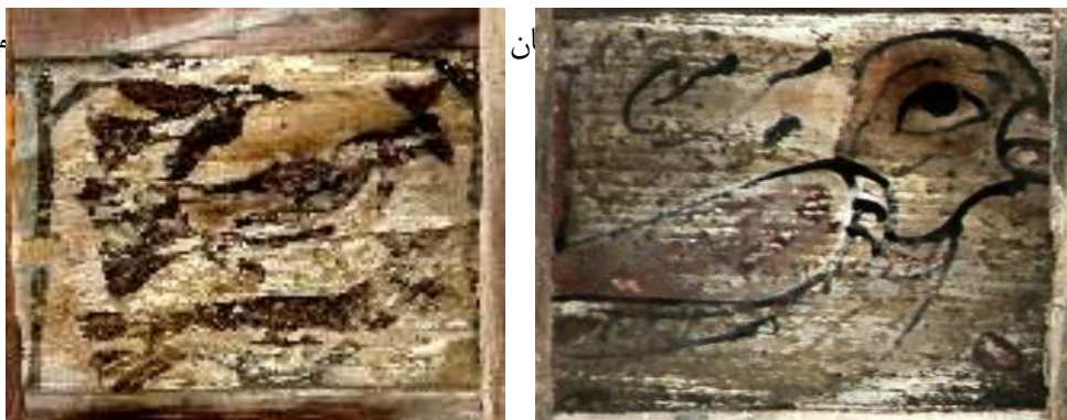
تصویر ۷: نقش پرنده-سمت راست: بنای خداوردی، سمت چپ: بنای پیرتکیه

در بین نگاره‌های خانه مفتاح، هم‌نشینی بلبل و کبوتر در بین نقوش گیاهی (ختایی و اسلیمی) مشاهده می‌شود (تصویر ۲۲). گیاه، نماد رشد و حاصلخیزی و پرنده نیز همان‌طور که گفته شد نماد ابر و باران است و این دو نشانه، در کنار هم مفهومی از حیات هستند. از نگاهی دیگر شاید هنرمند با نقش کردن فضا، به شیوه گل و مرغ به نوعی خواسته وضعیت حس نه