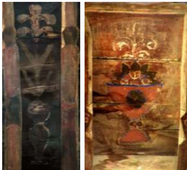
تصویر ۲۱: نقش گلدانی- بنای حاج قاسمی

تنها گل استفاده شده در این گلدان‌ها زنبق است با ساقه‌ای بلند، برگ‌هایی دراز و کشیده و گاهی با ساقه‌ای کوتاه که لبه گلدان‌ها از گل و برگ‌ها پوشیده شده است. تنوع رنگ‌گذاری به صورت سطوح رنگی تخت در این بخش بیش‌تر دیده می‌شود.