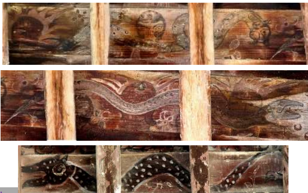
پیرسر بناهای قاجاری گرگان

در میان نقوش خانه دروکی (تصویر ۱۴)، تصویر تکرار شونده مار که با حرکتی موجی شکل بدن که موج آب را تداعی کرده و نشانگر همبستگی‌اش با برکت، بارندگی و پاییدن آب است. جهت حرکت این مارها در قالب نواری افقی که رودی خروشان را تداعی می‌کند، کل سطح زیر سقف را می‌پیماید. بدن این مار با شاخی که بر فراز سر دارد، نماد و حافظ آب است. شاخ، خود سمبل و نمادی از هلال ماه است و ماه که حرکاتش سبب جزر و مد آب‌هاست، در فرهنگ‌های مختلف همواره با آب پیوند دارد (رحیم‌زاده، ۱۳۸۲: ۲۲۵).