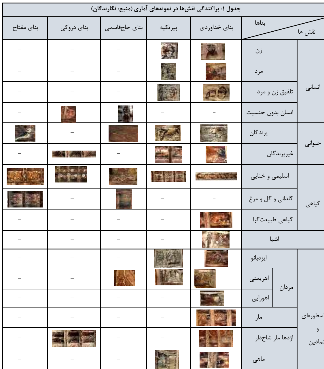
جدول ۱: پراکندگی نقش‌ها در نمونه‌های آماری

عنوان مقاله: خاستگاه شناختی، طبقه‌بندی و تحلیل نقش‌های شیرسر بناهای قاجاری گرگان