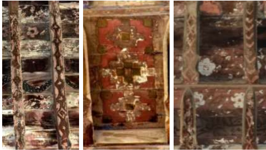
تصویر ۲۵: نقش هندسی

بین آن‌ها ختایی ساده دیده می‌شود، خطوط مورب موجی، خطوط متقاطع که ایجاد نوارهای زنجیره‌ایی به شکل لوزی‌های ممتد کرده‌اند، تقسیمات هندسی مربع که برگرفته از نقوش بنایی در تزئینات معماری است.