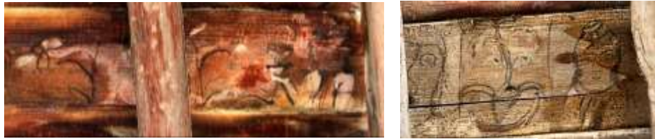
تصویر ۲۳: نقش گیاهی طبیعت‌گرا- بنای خداوندی

گیاهان این گروه، به صورت درختچه، نهال و یا گلدان گلی در دست زن طراحی شده‌اند. این گیاهان طبیعی هستند. دارای تنه و شاخه‌اند و ریشه در خاک و یا گلدان دارند. به موجب فرآیند رشد از دانه‌های کوچک به تنه‌ای تنومند و تداوم این حیات در چرخشی مدام، نماد جاودانگی است (کوک، ۱۳۸۷: ۹) در تصویر، گیاهی نهالی شکل، بر پایه هلالی شکل ماه را نشان می‌دهد و این نشانه فراوانی و یا یکی از درخت‌های کیهانی است (پوپ، ۱۳۸۷: ۲۷) و گلدان گلی که در دست زن ترسیم شده نشان از برکت دارد.