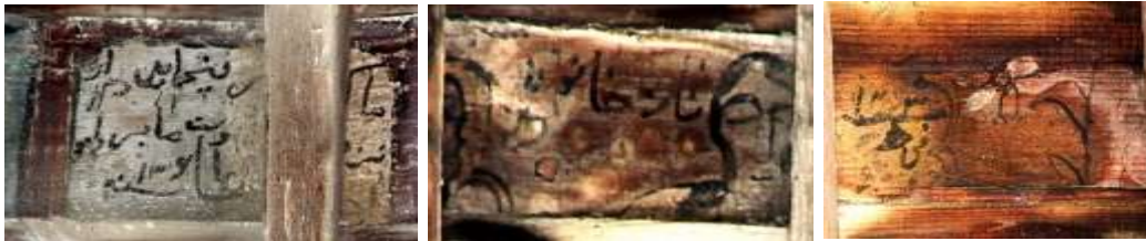
تصویر ۲۴: کتیبه- بنای خداوردی و پیرتیکه (منیم: نگارندگان)

آنچه در این تحقیق مدنظر است کتیبه‌هایی است که در میان نقاشی‌ها، به خطی ساده و به رنگ سیاه تحریر شده‌اند و جنبه کاربردی دارند. این نوشته‌ها مربوط به هنرمند نقاش است که در میان نگاره‌ها دیده می‌شود؛ همچون امضای نقاش، ثبت تاریخ اجرای اثر و همین‌طور نام بعضی از موضوعات در کنارشان نگارش شده است.