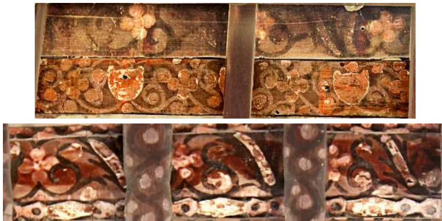
تصویر ۲۰: نقش گیاهی (ختایی و اسلیمی)

زیبایی و شکوه تذهیب‌گونه‌ای در اغلب شیرسرهای بناهای تاریخی گرگان ایجاد شده و در ترکیب با خوشنویسی‌ها و نقاشی‌ها چشمگیر است اما از دور، زیرا از نزدیک و با دقت که به آن‌ها می‌نگریم در می‌یابیم که نظم آن‌ها بدوی است؛ چنان بی‌نظم و خام‌دست هستند که اگر شخصی برای نمونه بخواهد از روی آن‌ها نسخه‌برداری کند هیچ‌گاه به نتیجه مطلوب نمی‌رسد. نگاره‌ها به دو دسته؛ گاه به صورت اسلیمی بر روی قوس حلزونی (بند اسلیمی) و در مواردی بر این حرکت، گل و برگ قرار گرفته و طرح ختایی را به وجود آورده‌اند. طرح‌های اسلیمی ساده‌اند و طرح‌های ختایی با گل‌هایی در قالب دایره و گل‌هایی هشت‌پر، شش‌پر و پنج‌پر طراحی شده‌اند. ترکیب برگ در طرح‌های ختایی ساده و کوچک و یا برگ‌های کنگره‌دار (لوتوس) است.