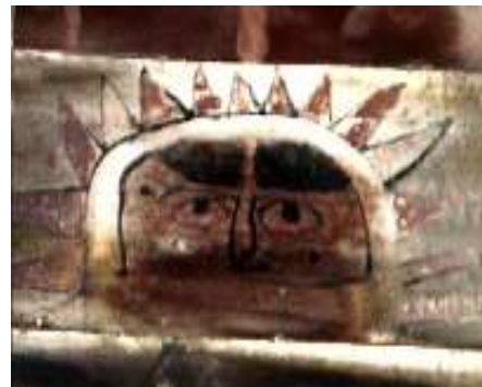
تصویر ۱۶: خورشید- بنای خداوردی