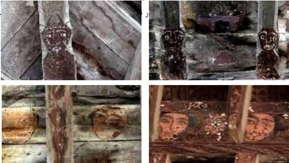
تصویر ۵: دو تصویر بالا، نقش انسانی بدون جنسیت- بنای حاج‌قاسمی - تصویر ۶: دو تصویر پایین، نقش انسانی بدون جنسیت- بنای دروکی (منبم: نگارندگان)