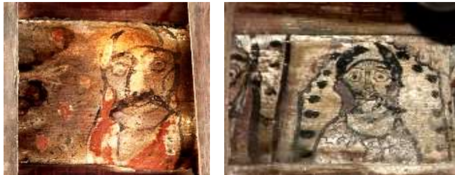
تصویر ۱۲: مردان اهریمنی، سمت راست: پیرنکیه و سمت چپ: خانه خداوردی (منبع: نگارندگان)

گونه دیگر، چهره‌های کریه نقش شده بر زیر سقف‌ها را می‌توان تعمیم داد به دیو قحطی و خشک‌سالی، اپوش در برابر ایزد باران که اصل خیر بوده است. تفسیر دیگر از تصویر شدن مردان اهورایی در کنار مردان اهریمنی سمبلی دیگر از تضاد دوگانگی درونی و نفسانی انسانی است، یعنی نیمه شیطانی با صفات نکوهیده و عادات زشت و غلط به‌عنوان دیو و نیمه الهی که به خصایص نیک و پاک آدمی اشاره دارد و به‌عنوان ایزد یاد می‌شوند و درنهایت جمع این دو ضد، قالب انسان را می‌سازد.