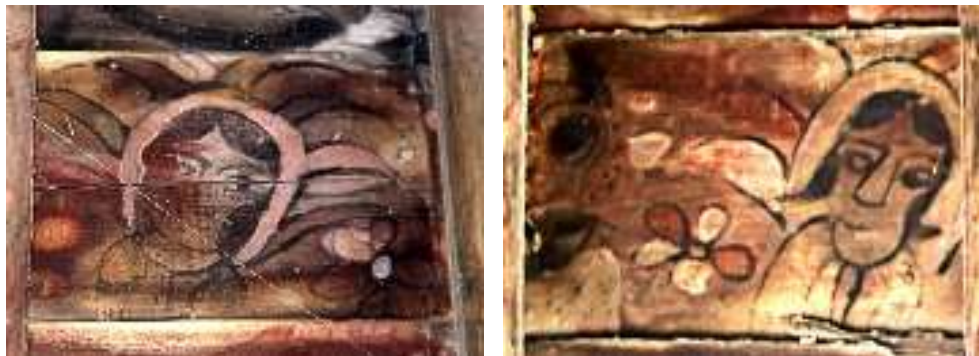
تصویر ۱۰: چهره ایزدبانوان - بنای خداوردی

از سویی آناهیتا مظهر عشق و ملاحظت و جمال است؛ کهن‌الگوی باستانی، معشوق شعری ما ایرانیان است (مظفری، ۱۳۸۱: ۸۳) و این صفت آناهیتا از لحاظ عاطفه و عشق؛ عشقی که موجب تشکیل خانواده می‌شود، همواره در مفهوم خود خصایص زن است و در هر دوره پیشاهنگ این دو خصیصه است. برداشت دیگری که از نگاره‌ها می‌توان داشت این‌که هنرمند با این روش خواسته جلال و حریمی والا برای زنان جامعه خود قائل شده، نگاهی مقدس و الوهی به آنان داشته و بخشیده باشد.