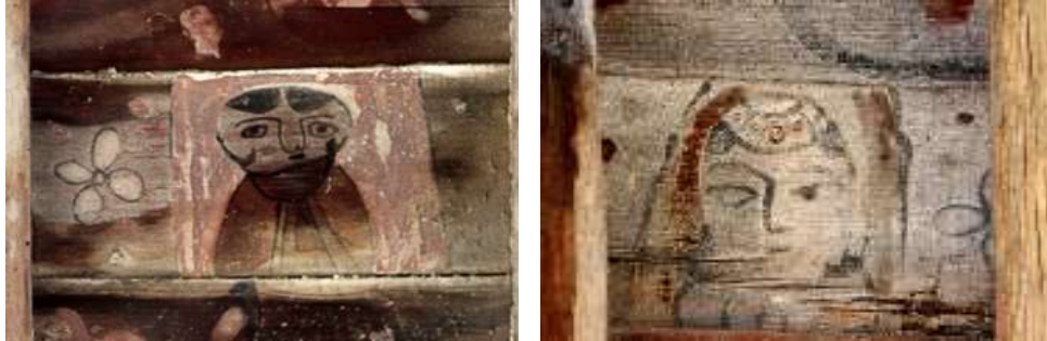
تصویر ۲: چهره زنان- بنای خداوردی

و همین‌طور ورود زن به عرصه دیده شدن دانست. تعاملات زنان ایرانی با زنان خارجی در دوره قاجار که مفهوم آزادی زن را برای ایشان ملموس ساخت، با گریز از تفکر بسته زندانی ماندن در حصار خانه و بچه‌داری، می‌تواند عواملی باشد تا هنرمندان و نخبگان به نیاز حضور زن در عرصه‌های اجتماعی بپردازند و زن در بسیاری از مناسبات اجتماعی فرهنگی و هنری جلوه‌گر شده، تغییر وضعیت داده و دیده شود.