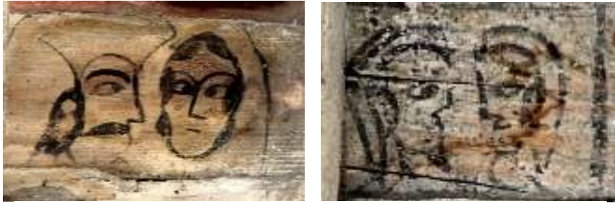
تصویر ۴: تلفیق چهره زن و مرد- تصویر سمت راست: بنای پیرتکیه، تصویر سمت چپ: بنای خداوردی

تقابل و قرارگیری نقش زنان و مردان در این آثار (تصویر ۴) می‌تواند جامعه‌ای را تصور کند که اقتدار سیاسی، اجتماعی با مردان است؛ جامعه مردسالارانه که حق مالکیت، قضاوت و پیشوایی دین به عهده مردان است اما در عین حال زن هنوز در مرکز کانون خانواده قرار دارد و شریک اموال مرد است. از گونه دیگر، ترکیب زن و مرد، روابط عاشقانه‌ای است که ریشه در قصه‌ها داشته و یا می‌تواند نوعی از روابط زناشویی و نمایش نیک‌بختی دو زوج باشد. استدلال دیگر از این ترکیب، به رابطه اساسی زن و مرد در توالد، تناسل و یا زایش می‌پردازد؛ رابطه‌ای که بنیان‌گذار بقا در جهان و سرچشمه باروری است.