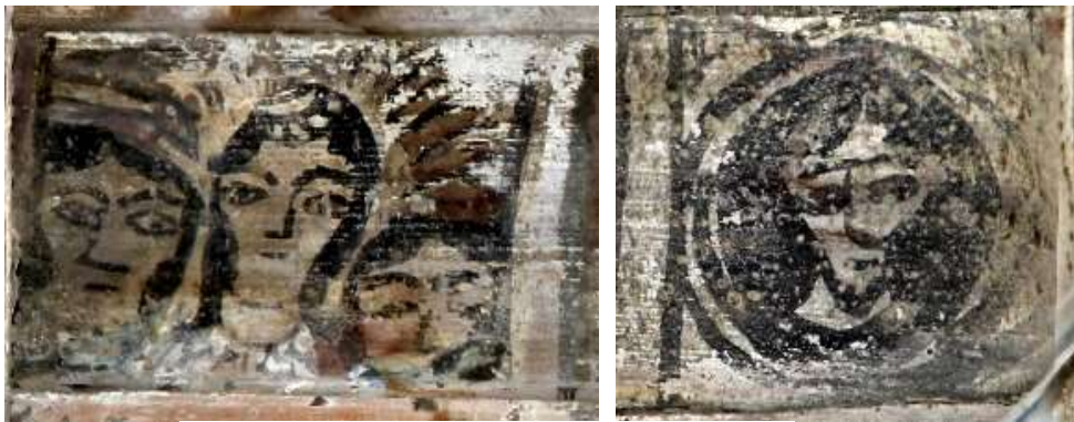
تصویر ۱: تصاویر انسانی متأثر از عکاسی - بنای پیرتکیه

بخش نسبتاً وسیعی از موضوعات به نقوش انسانی اختصاص دارد و با بررسی این نگاره‌ها، می‌توان چنین نتیجه گرفت که تأثیرات اجتماعی و نوع و نگرش زندگی مردم به‌ویژه زنان، به‌عنوان بخشی مهم از جامعه روزگار قاجار، در شیوه و سبک نقاشی شیرسر بناهای این دوره انعکاس یافته است. چهره‌هایی که نمایانگر هم‌آمیزی سنت‌های ایرانی و اروپایی در یک قالب پالایش یافته و شکوهمند است (پاکباز، ۱۳۸۵: ۱۵۱). از دیگر سو در نگاره‌های انسانی تأثیر عکاسی بر چهره‌نگاری‌ها دیده می‌شود (تصویر ۱)، تصاویری که به نگرنده زل زده‌اند، همان کاری که در هنگام عکاسی و در آثار عکاسی آن زمان دیده می‌شود. با مشاهده ژست و نحوه کادربندی موضوعات که به صورت آلبوم عکس بر چوب نقش بسته‌اند و در مواردی بیش‌تر به یک قاب عکس شباهت دارند، این گمان برای نگارندگان پیش آمد که شاید هنرمند عامی در ترسیم این آثار از عکس استفاده کرده باشد که این شیوه ترسیم شدن متأثر از فن عکاسی و عکس‌های روزنامه‌نگارانه، تصاویر چاپ و محصولات وارداتی غرب بوده است (ابراهیمی‌ناغانی، ۱۳۸۸: ۲۲).