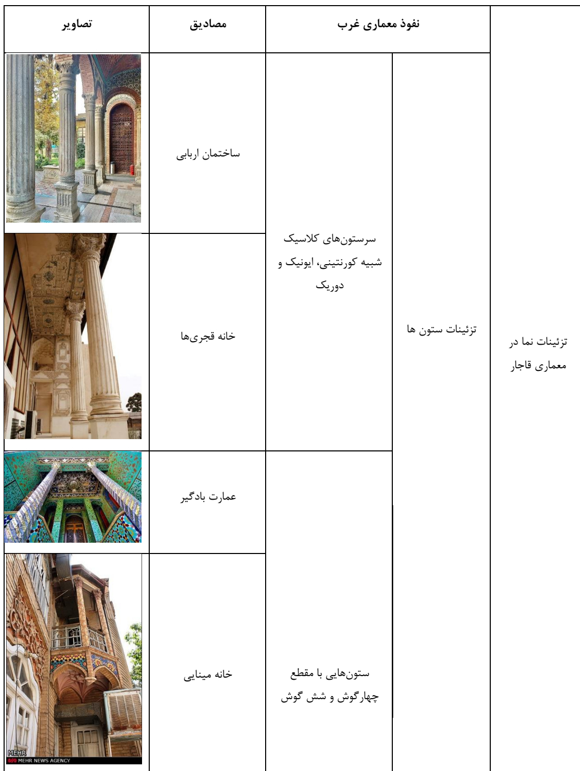
جدول ۱. مصادیق تأثیرپذیری در تزئینات نمای معماری قاجار (نگارنده)